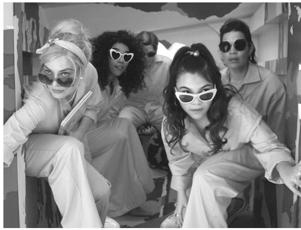
Filmo „Barbė“ kadras

Šiame kontekste atsiranda filmas „Barbė“ (rež. Greta Gerwig) – ryškiai rožinis, moteriškas, plastmasinis, trumpiau tariant, visiškai like the other girls . Tuo kai kurios filmo interpretacijos ir pasibaigia. Pamatyta visiškai moteriška estetika yra užpildoma visais kitais stereotipais, ypač būdingais blondinėms, – lėkšta, nevertinga, neturi gilių ir universalių idėjų. Vis dėlto, kaip didžiulio biudžeto Holivudo filme, „Barbėje“ esama subversyvumo. Filmą gal neskleidžia visiškai